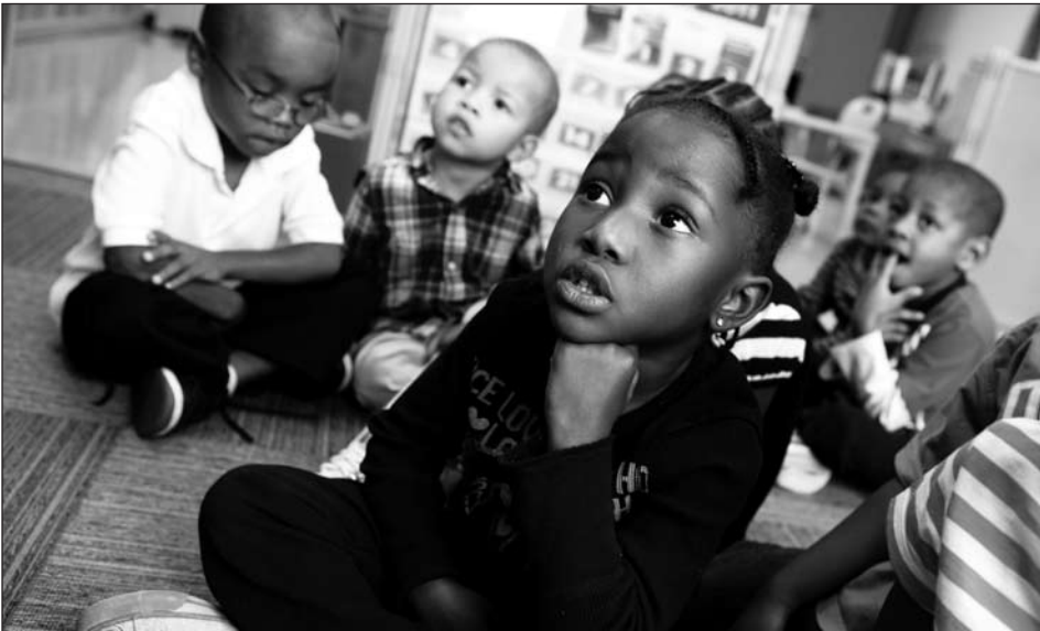
Estudiantes preescolares en el Mitzi Freidheim Englewood Child and Family Center escuchan mientras su maestra les lee un cuento. Actividades como éstas ayudan a los niños a mejorar sus destrezas de alfabetización.

Puede que los niños en educación preescolar parezcan estar simplemente jugando, pero importante aprendizaje se está llevando a cabo—aprendizaje que es esencial para el éxito cuando la educación formal comienza. Eso es especialmente verdadero para los niños provenientes de familias de bajos recursos. Los estudios han hecho evidente ese punto: